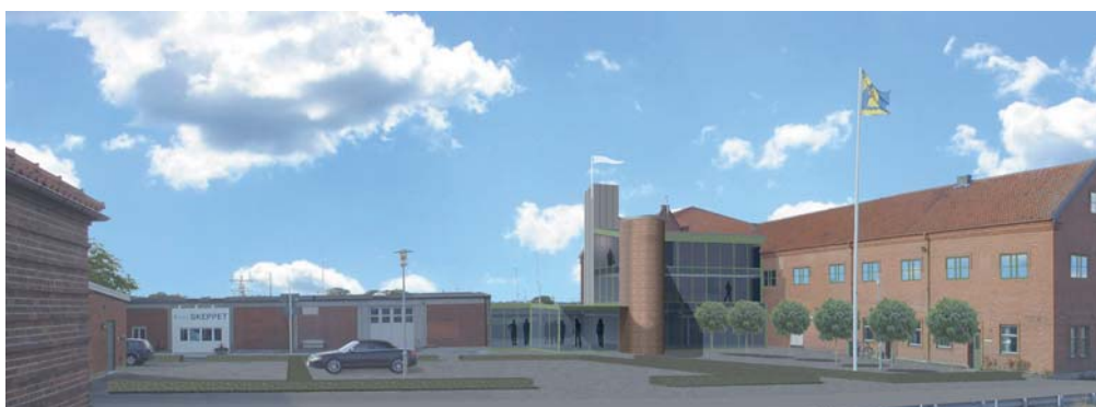
Entrévy mot söder

Det fysiska tillskapandet av Marint centrum genomförs under 2010, med byggstart planerad till mars och i höst är det dags för invigning och inflyttning.